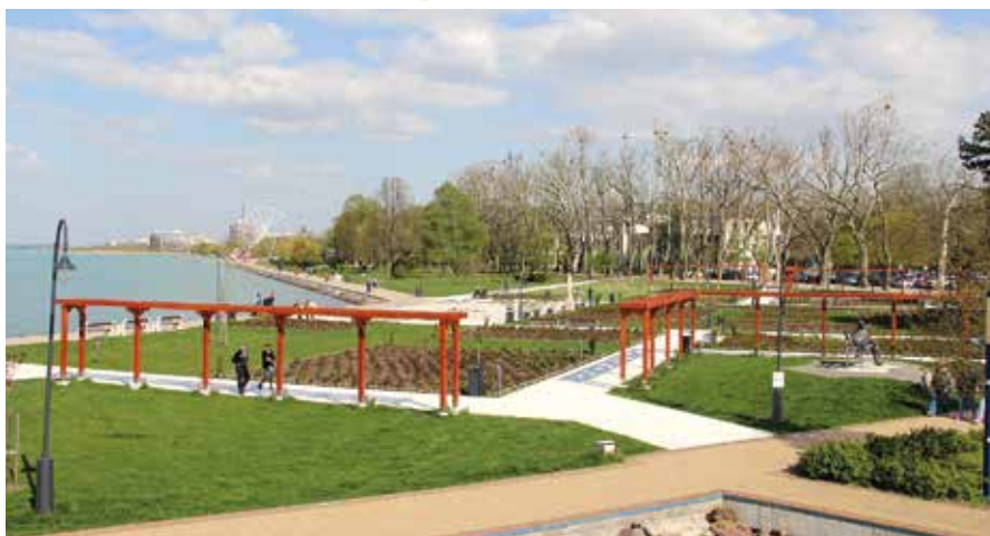
A pünkösdi rózsaiünnepre ennél is szebben pompázik majd a Rózsakert