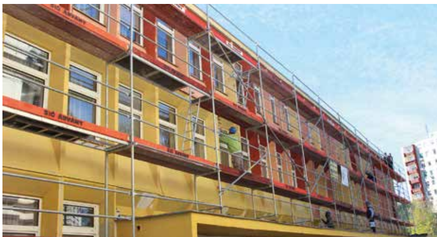
Sárga színű lesz a megújuló városháza