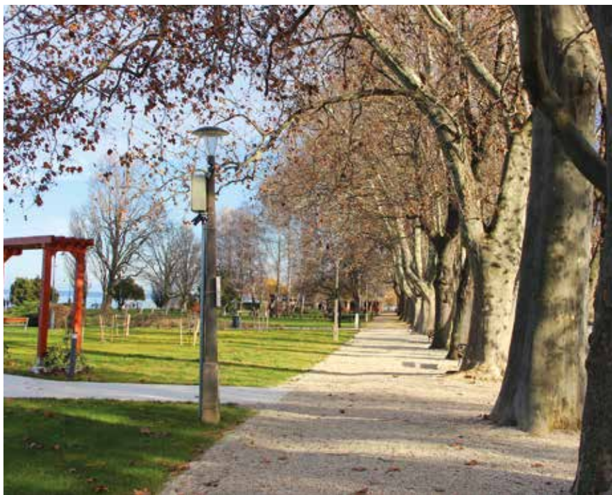
A Rózsakert felújítandó keleti fele, valamint a platánsor a sétánnyal

► hanem a sajátunkat látjuk el munkával, és juttatjuk bevételhez. No és legfőképpen azért, mert tavaly jó munkát végeztek, ha meg nem végeznének azt, saját cégeként könnyebb elérni őket és adott esetben az utómunkákat, garanciális javításokat is elvégeztetni. A tervek szerint tavaszra elkészülhet az Isztria sétány (vagyis a Petőfi sétány és a Balaton-part közötti kavicsos sétálóút) felújításának tervezése, engedélyezése, és elindulhat a munka is. A nyári szezonra a sétány új szegélyezést kap és új gyöngykavics töltést (ezzel egyébként a Rózsakert ezen részét hagyományos formájában, csak felújítva tartjuk meg), új padok és szemetesek is kihelyezésre kerülnek. Őszre pedig minden készen áll majd arra, hogy a sétány és a part között kiépíthessük az új locsolórendszert, ehhez csináltassunk egy kutat is, elvégeztessük a terület fűvesítését, sövényesítését és fásítását is, valamint a sétány és a part közötti átjárókat térkövezéssel lássuk el. 2024 tavaszára a Rózsakert és környéke teljesen megújul, és újabb néhány évtizedre az itt élők és ide látogatók méltán kedvelt helye lehet.”