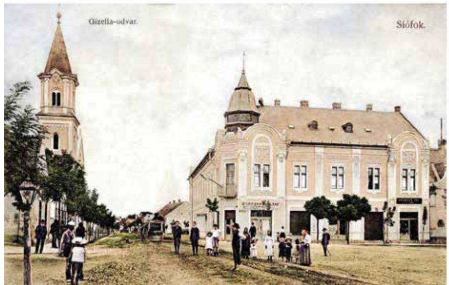
A főter (piactér) 1880-ban és 30 évvel később, 1910-ben