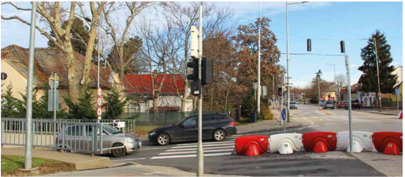
Valahol itt érhetett véget Siófok falu kétszáz évvel ezelőtt, akkoriban még ettől északi és nyugati irányban is a Balaton hullámozott

Az előző oldalakon a fürdőélet kezdetére emlékeztünk vissza, most ugrunk visszafelé az időben még egyszer száz évet, és rácsodálkozhatunk például arra: Siófok falu nyugati széle a mai Vilma, Vitorlás és Fő utcák találkozásánál volt, ott szó szerint véget ért, hiszen onnantól északi és nyugati irányban is még az Ős-Balaton hullámozott. Az Ős-Balaton partvonala az 1838-as térkép szerint a mai Semmelweis és Kandó utcák nyomvonalaán haladt, a Siótól nyugatra csupán egy lakóház állt akkoriban, a későbbi Vilmatelep előhírnökeként.