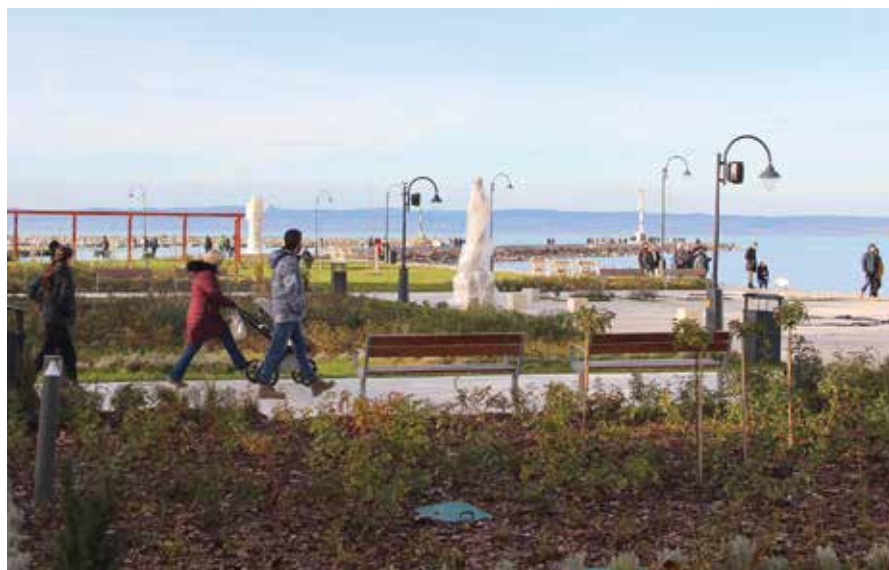
A Rózsakert télen. Karácsony és szilveszter között is sokan sétáltak a parton.

„Az előkészületek már folynak – mondta a siófoki városvezető. – A 2022 nyarára elkészült második ütemhez hasonlóan a harmadikat is célszerű volna a Siókomra bízni. Egyrészt mert 100 százalékban önkormányzati tulajdonú cég városunk meghatározó tulajdoni hányadával, másrészt mert nem egy magán kft.-t, ►