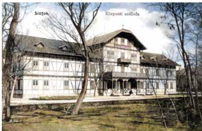
Az 1948-ban lebontott Központi Szálloda 1907-ben