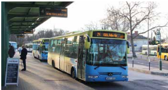
Indul a 24-es, azaz csak indult, mert januártól ilyen jelzésű busz már nem közlekedik.