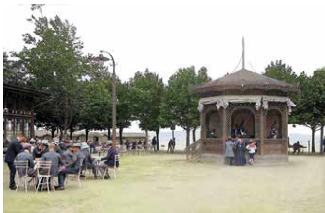
A parti zenepavilon 1908-ban