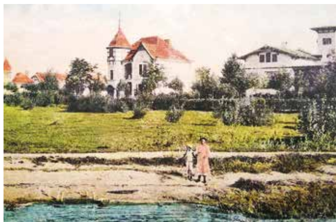
A parti villasor 1920-ban

► művészek követték; Than Mór, Vágó Pál és a többiek.