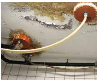
Képeink a fürdő 2021-es bezárása után készültek

újítása, 200 millió forint erejéig. Évtizedek óta alig történt ott fejlesztés,