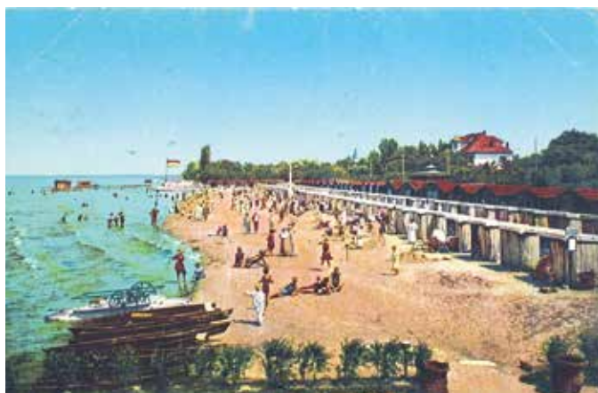
Siófok fővenystrandja 1915-ben, az első vízbiciklis kép