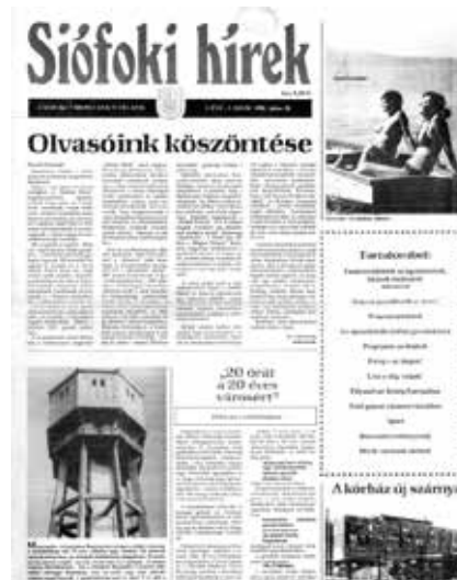
35 éve, 1988. júliusában jelent meg először a Siófoki Hírek.

Részletek a friss helytörténeti kiadványban. F. I.