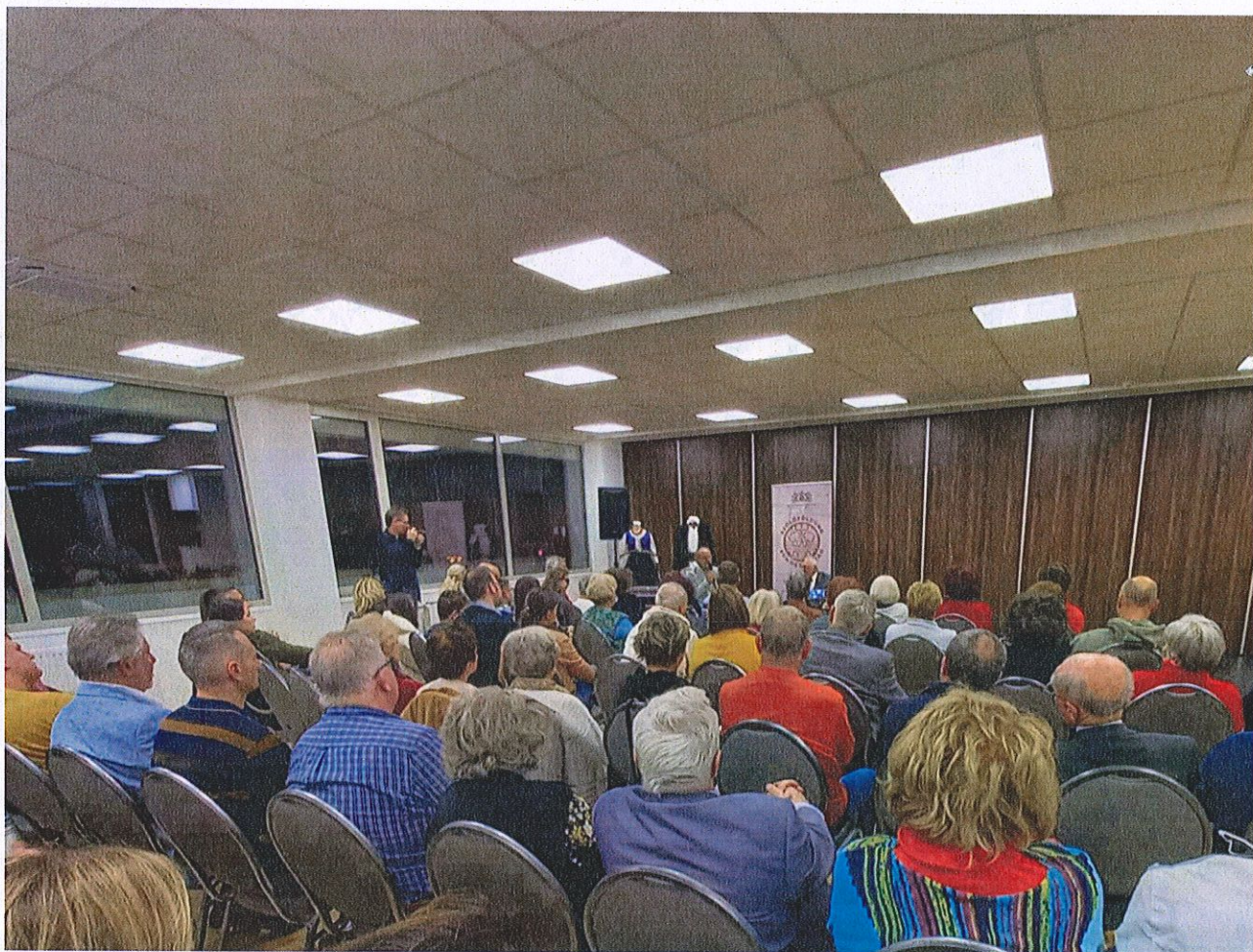
"Egy kottafüzet bemutatója" program