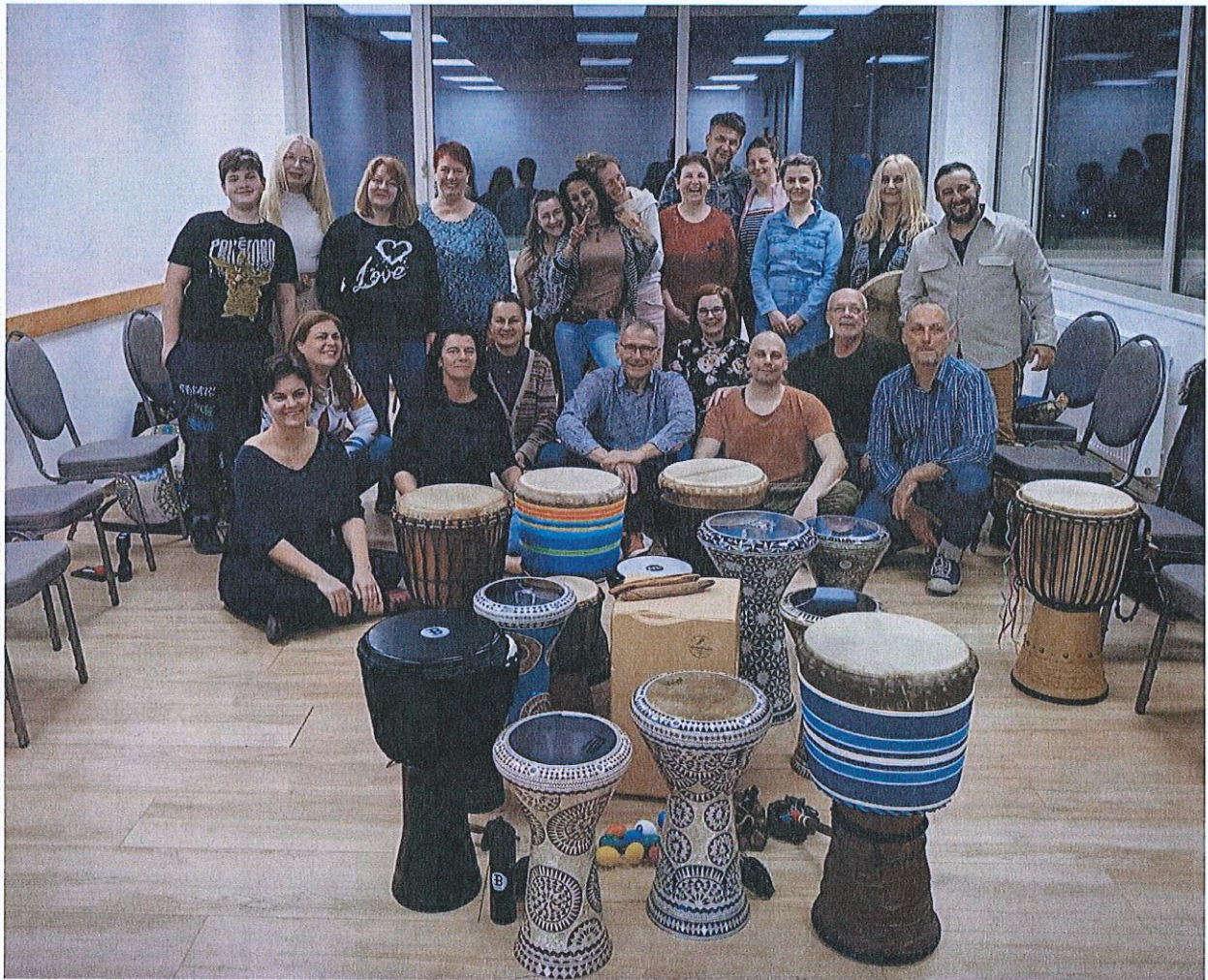
6.2.6. Balaton Táncműhely