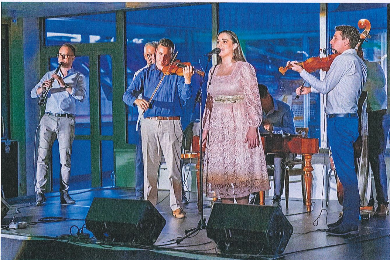
6.2.4. Juhos együttes