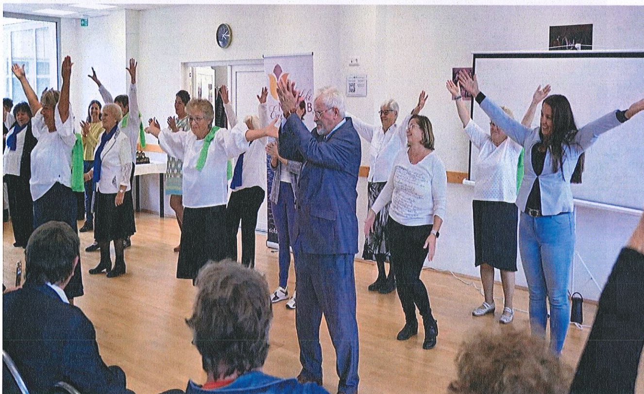
65 éve alakult a Siófoki Nőklub Egyesület jogelődje