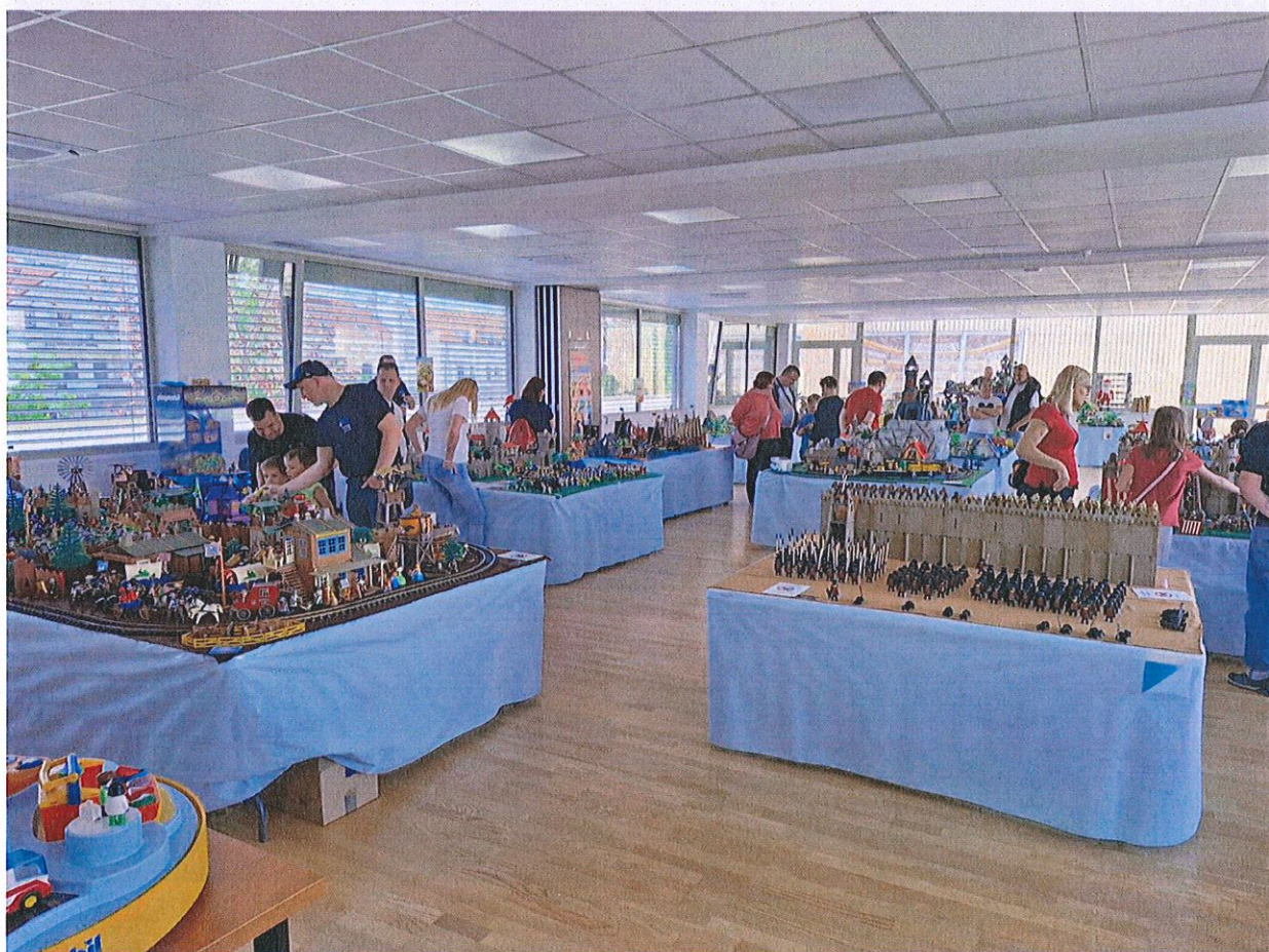
Playmobil és Schenk játékgúrá kiállítás