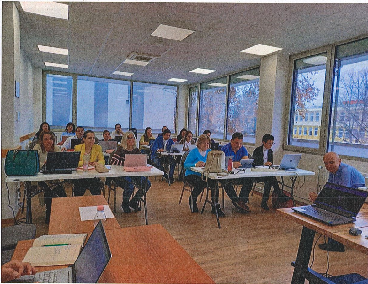
Somogyi Kereskedelmi és Iparkamara "A mesterséges intelligencia" című workshopot