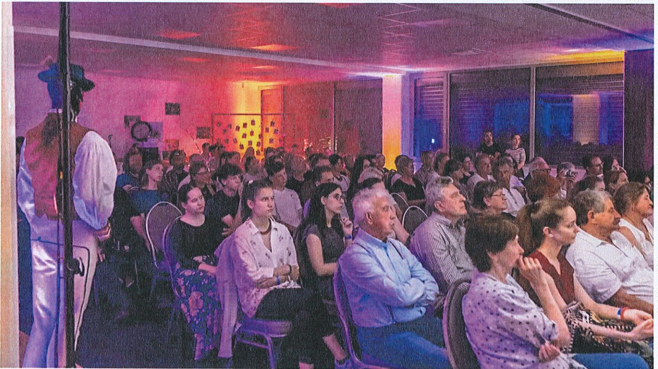
6.2.3. Tarsoly zenekar koncert és táncház