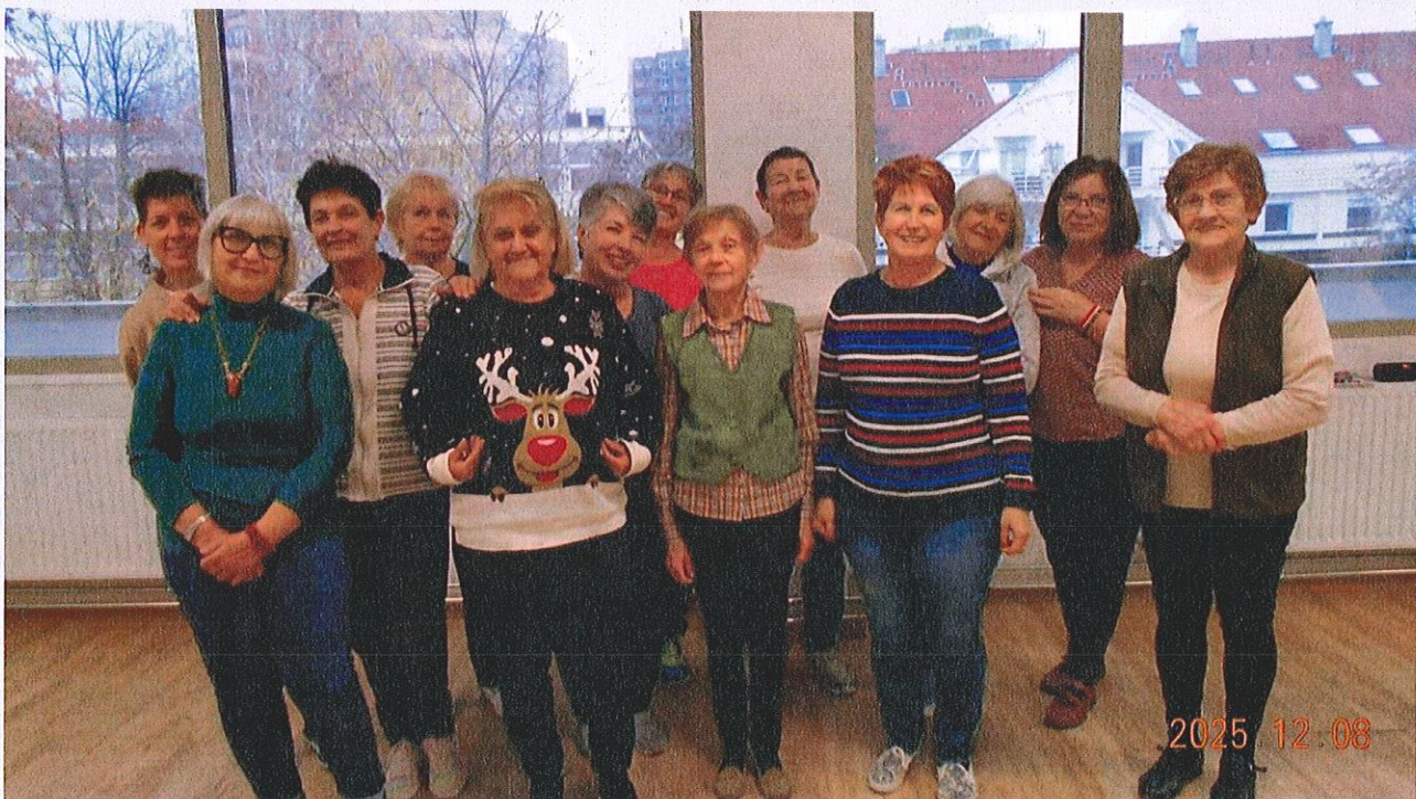
Siófoki Szenior Örömtánc