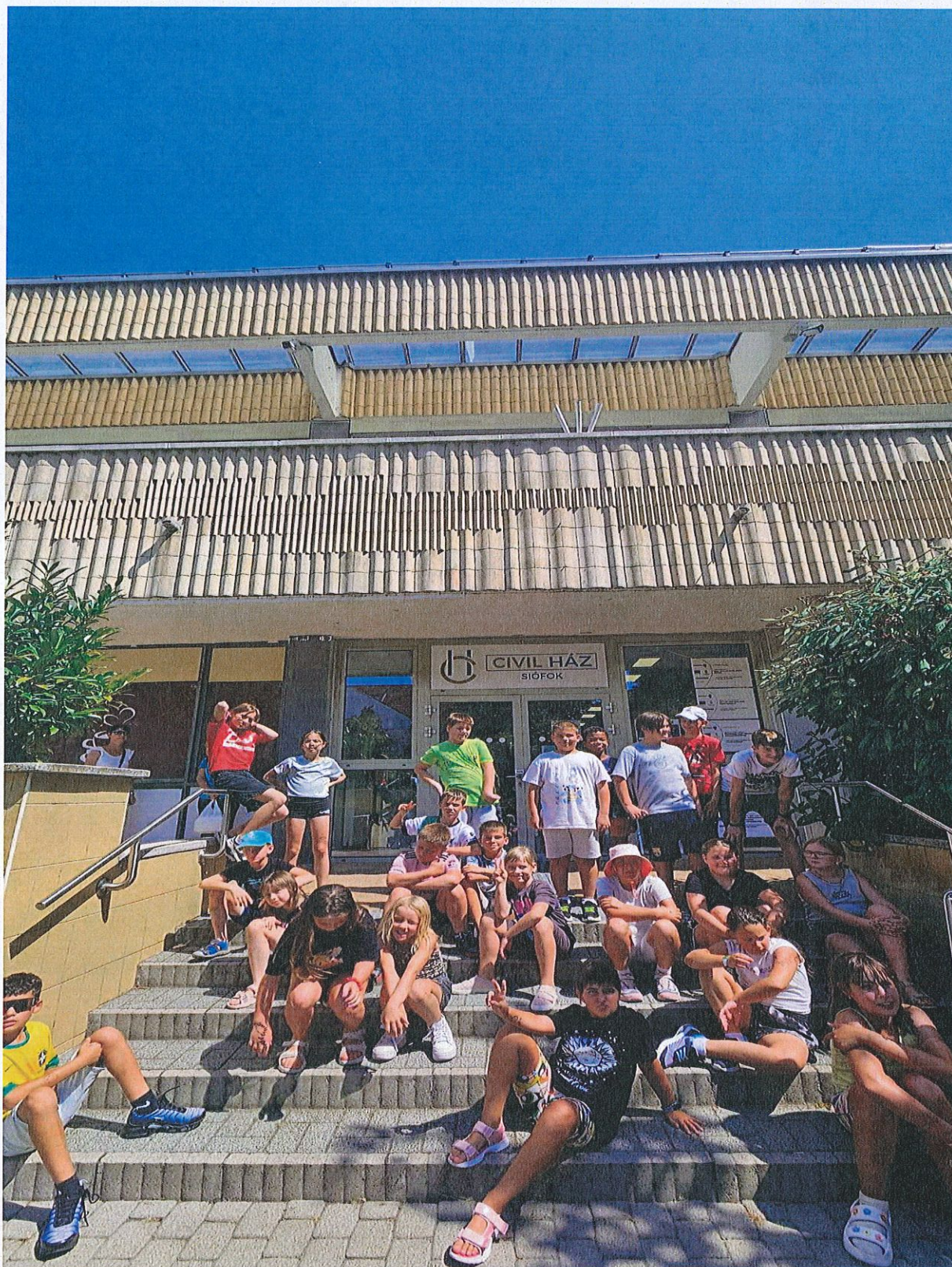
Gondozási Központ Család- és Gyermejkölési Központ egy hetes tábora