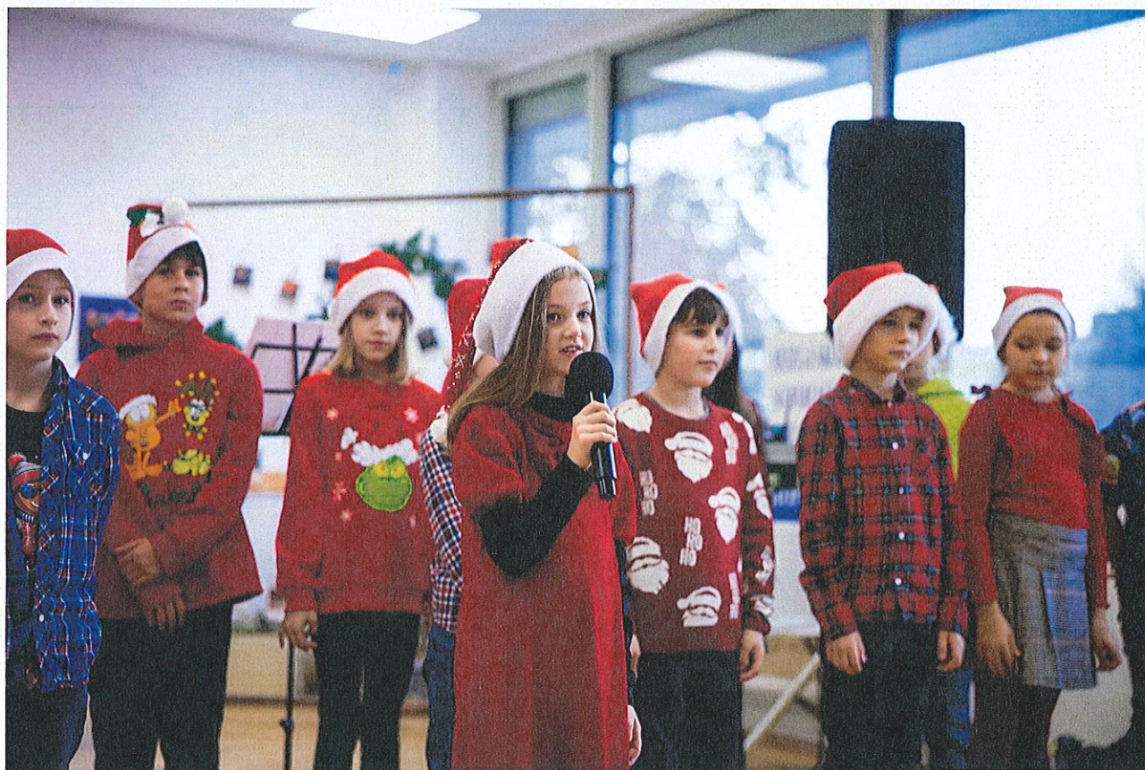
Mozgáskorlátozottak Somogy Megyei Egyesülete siófoki csoportjának karácsonyi ünnepsége