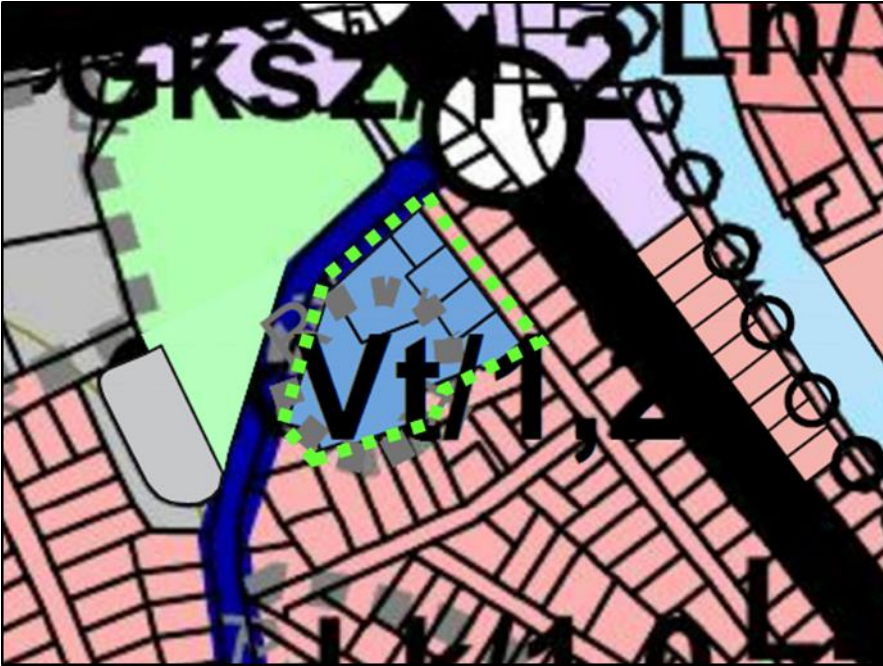
A Településszerkezeti terv módosítása (2-es módosítás)