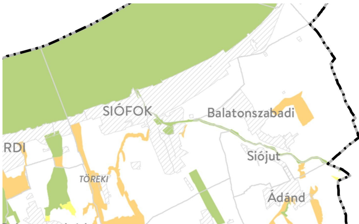
Somogy Megye Területrendezési Terv – ökológia lehatárolások ( http://www.som-onkorm.hu/somogy-megye-teruletrendezesi-terve-2020.html )