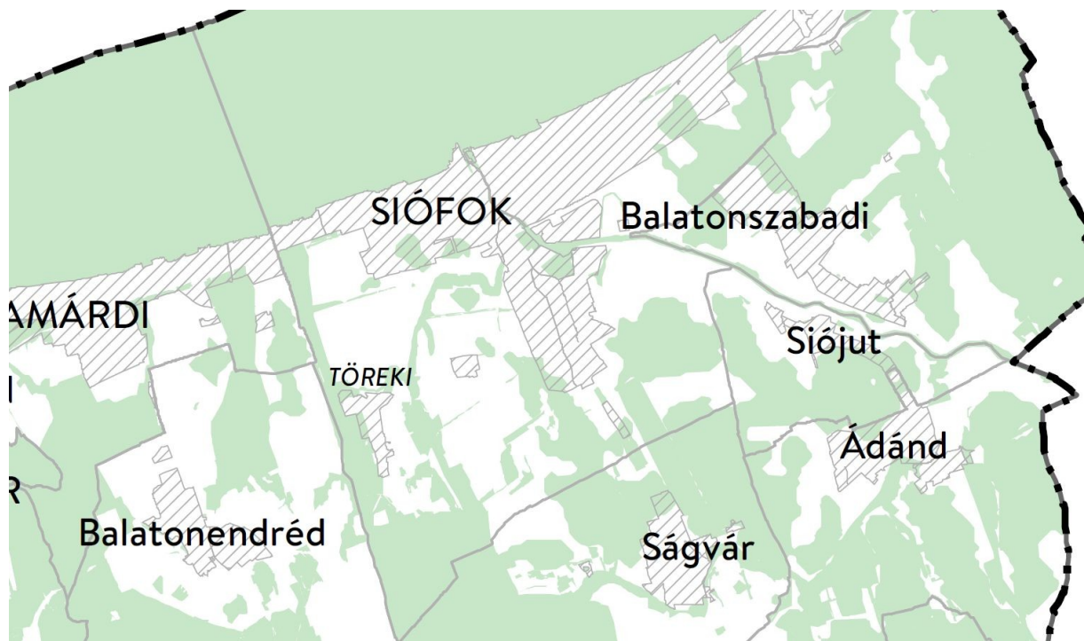
Somogy Megye Területrendezési Terv – Naperőmű létesítés céljából korlátozottan igénybe vehető terület övezete ( http://www.som-onkorm.hu/somogy-megye-teruletrendezesi-terve-2020.html )

A Somogy Megyei Közgyűlés Elnökének 6/2020.(III.16.) önkormányzati rendelete Somogy Megye Területrendezési Tervéről az alábbiakat tartalmazza a naperőmű építésről: