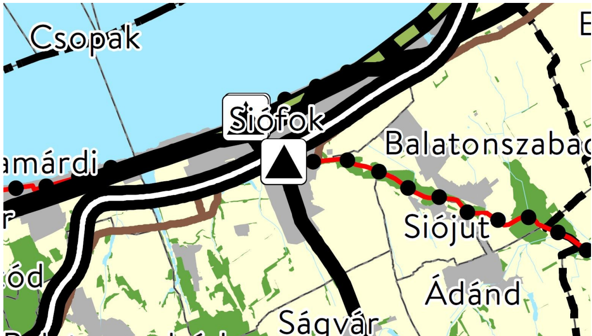
Országos rendezési terv részlet (forrás njt.hu - 2018. évi CXXXIX. törvény)

A településrendezési és az építészeti-műszaki tervtanácsokról szóló 252/2006. (XII. 7.) Korm. rendelet településrendezési tervet érintő tervtanácshoz benyújtandó dokumentumaira vonatkozó rendelkezéseit és a Siófok Város Önkormányzat Építészeti-műszaki Tervtanácsának létrehozásáról és működési rendjéről szóló Siófok Város Önkormányzata Polgármesterének 2/2021. (I. 21.) önkormányzati rendelete alapján az alábbi vonatkozó országos és megyei rendezési tervek és mellékleteit megvizsgálva az alábbi releváns térképmelléleteket kívánjuk csatolni elsődleges és előzetes vizsgálatra: