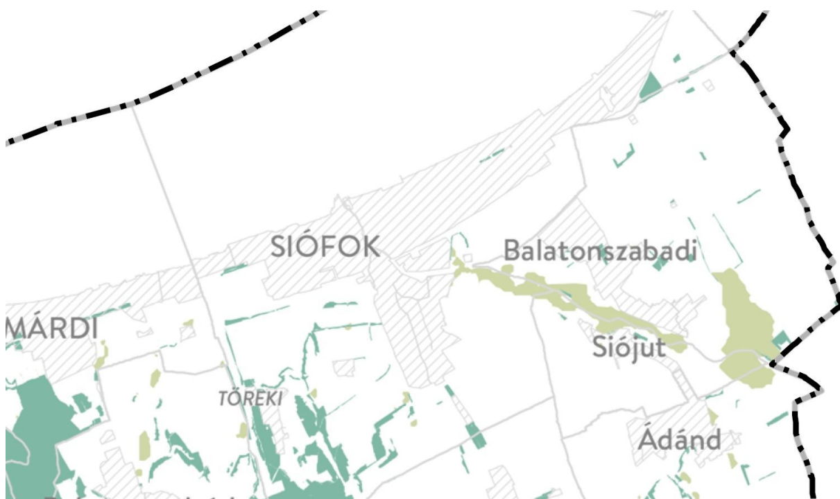
Somogy Megye Területrendezési Terv – erdős területek lehatárolása ( http://www.som-onkorm.hu/somogy-megye-teruletrendezesi-terve-2020.html )