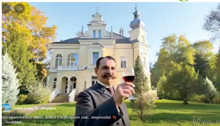
Ha már tudomány: 2026-ban már képes erre is a mesterséges intelligencia; Thanhoffer Lajos doktor ma, 120 év múltán, hajdani villája előtt. A kép természetesen meg is elevenedik: videó a Siófok Guide Facebook-oldalon vagy lapunk Facebook-oldalán.

S hogy ki is volt Thanhoffer Lajos doktor és hogyan kapcsolódik ahhoz a témához, hogy Siófok városa is csatlakozott 2026-ban a Tudománybarát Település (TUBA) mozgalomhoz, amit a 200 éves Magyar Tudományos Akadémia hirdetett meg? A tudománybarát.hu weboldal írja: „Thanhoffer Lajos (1843-1909) akadémikus, anatómus, hisztológus és egyetemi tanár volt, aki jelentősen hozzájárult a mikroszkópos anatómia és szövettan hazai fejlődéséhez. Nyírbátorban született régi nemesi család gyermekeként. Elsők között csatlakozott a siófoki nyaralók, majd pedig villatulajdonosok táborához, hiszen már 1897-ben megépíttette Siófok egyik későbbi ékességét. Thanhoffer Lajos publikációiban is felhívta a figyelmet a balatoni gyógyvíz jótékony hatásaira. Született például egy, A balatoni fürdők kedvező hatásáról című füzetke, melyben neves orvosok nyilatkoztak a témában. Ez tulajdonképpen a korszak egyik nagyon hatásos marketingkiadványa volt, hiszen egyértelműen a tó körüli fürdők népszerűsítése volt a célja.