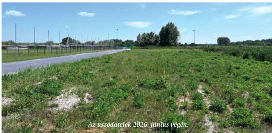
Az uszodatelek 2026. június végén.

Tárkányi Zsolt államtitkár (Tisza Párt) azt mondta Witzmann Mihály kérdésére válaszul: „Képviselő urat az előző kormány nem tájékoztatta megfelelően a projekt állásáról. A közbeszerzési eljárás jelenleg értékelési szakaszban van, az ajánlattételei szakasz csak előkészítés alatt, s a beruházáshoz nem áll rendelkezésre forrás. A költségvetés függvénye, mikor tud a Tisza-kormány forrást biztosítani. Dolgozunk az uniós források