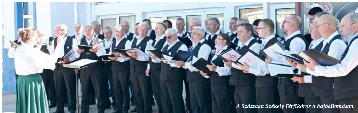
A Száztagú Székely Férfikórus a hajóállomáson