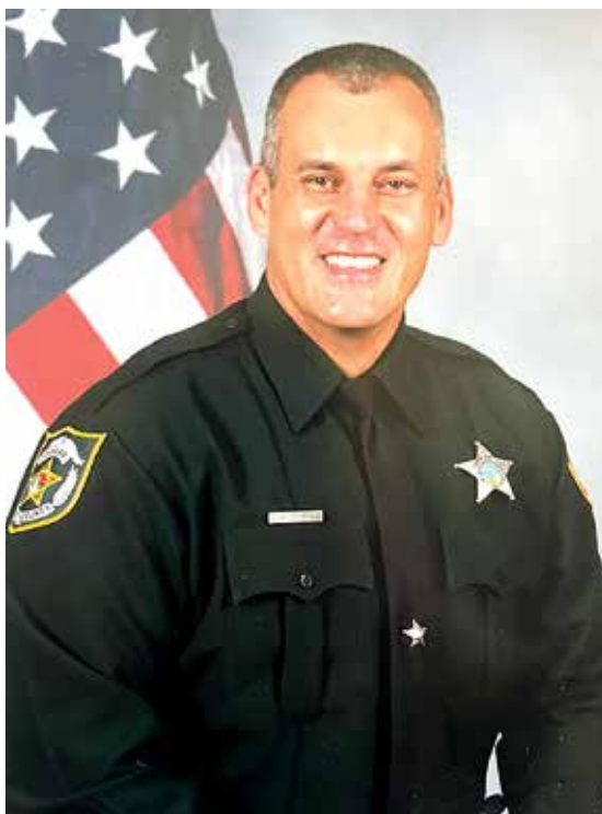
Seriffcsillaggal, kalap nélkül Orlandóban