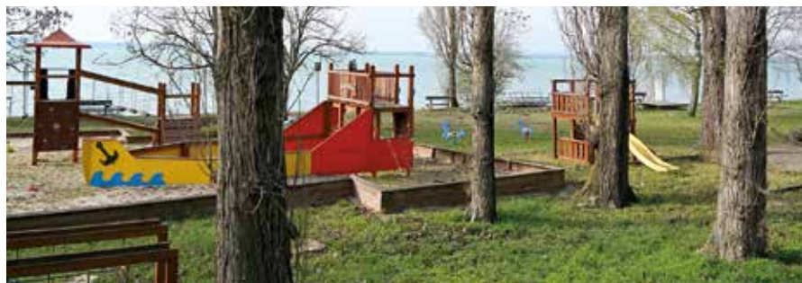
Gamászai strand: minden marad a régiben