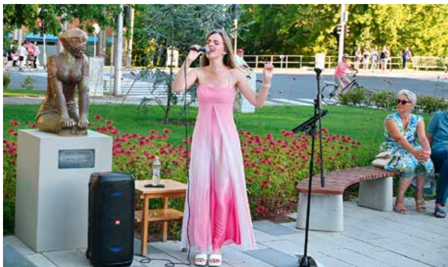
Egy rendezvény a díjazottak közül: a tavalyi első Utcazene Kavalkád