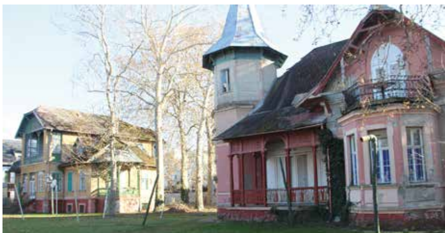
Kérdéses jövőjű villák a Petőfi sétányon

S itt újra előbukkan a 2005-ös évszám (ekktől érvényes a jelenleg is hatályos építési szabályozás),