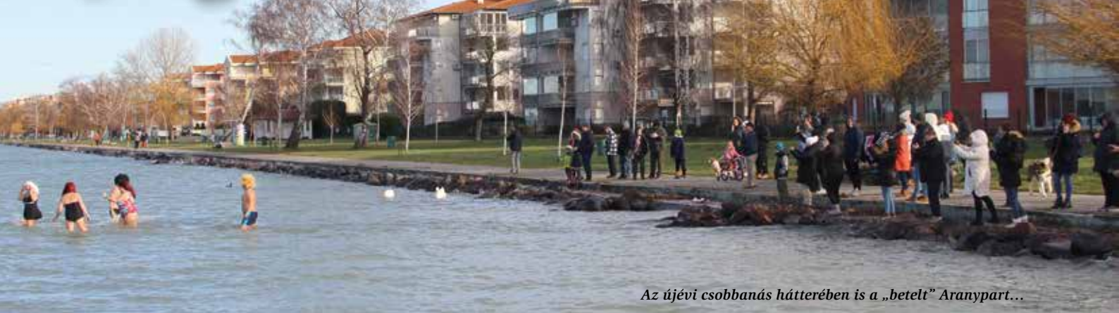
Az újévi csobbanás háttérében is a „betelt” Aranypart...

Már a középiskolások szemét is szűrja a Balaton-parti „apartmanházerdő”, a Siófoki Hírek novemberi számában megjelent tanácsnoki négyévértékelőben pedig két képviselő említette a problémák között: jó volna valamilyen módon megálljt parancsolni a vízparti apartmanlakások elszaporodásának. A felvetések jogosak (a diákok rácsodálkozó kérdése is az: