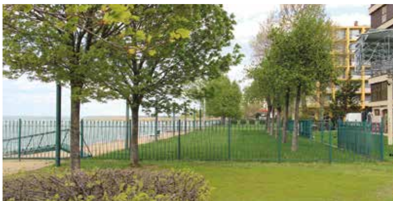
Kerítés a Nagystrand és a szállodasor között