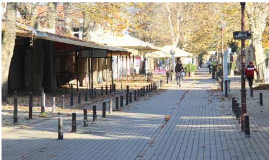
Csendes most a bulinegyed: a Petőfi sétány télen

A Kúria határozatának indokolása szerint a kormányhivatal indítványa megalapozott az alábbi pontokban: