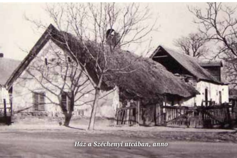
Ház a Széchenyi utcában, anno