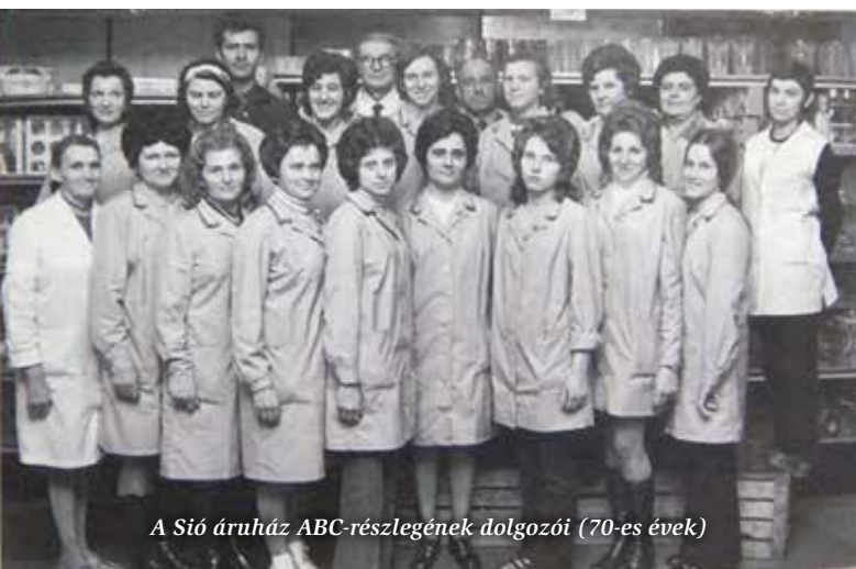
A Sió áruház ABC-részlegének dolgozói (70-es évek)

Az egy település évszázada című helytörténeti kiállítás pedig február 29-ig látható a könyvtár olvasótermében. F. I.