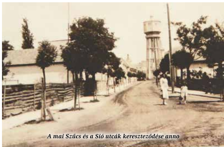
A mai Szűcs és a Sió utcák kereszteződése anno