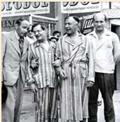
Siófoki nyaralóvendégek: jobbról Rejtő Jenő, Salamon Béla, Karinthy Frigyes.