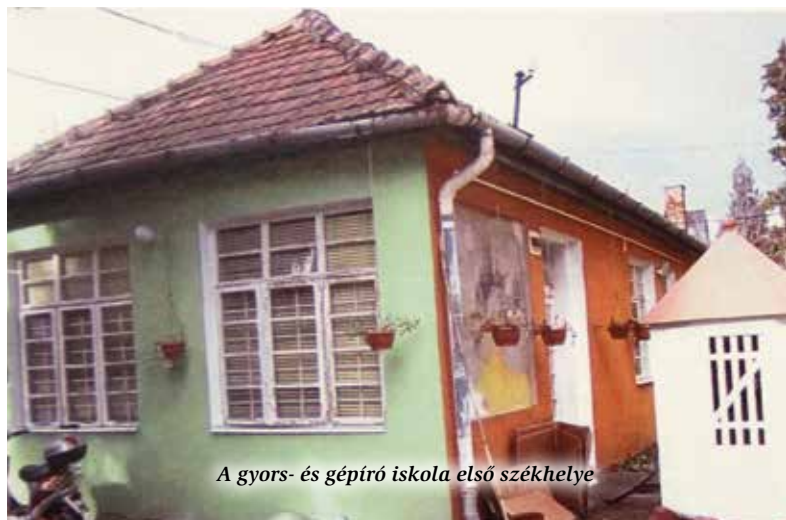
A gyors- és gépíró iskola első székhelye