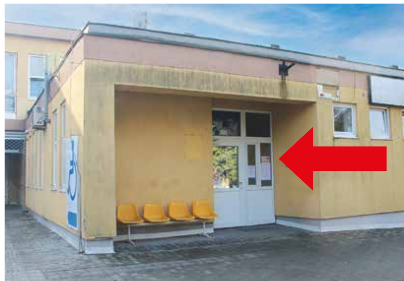
Az új kiliti orvosi rendelő a Dudás Károly Vendégházban és az új fogorvosi ügyelet az egykori rendelőintézetben