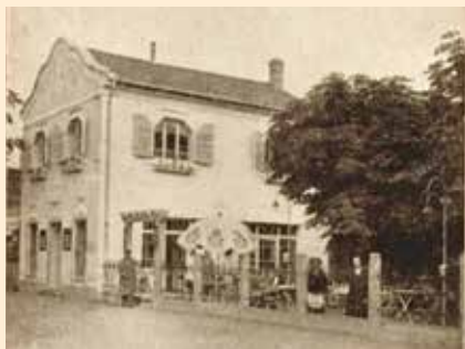
A későbbi Omnia, Shanghai, majd Dániel vendéglő, mára társasház épült a helyére.

árverezték, de az sem jelentkezett érte, aki így megszerezte... Talán a tulajdonos szomorú végzete is elriasztotta az öröklőket; 1932-ben ugyanis, ahogyan a lap emlékeztetett