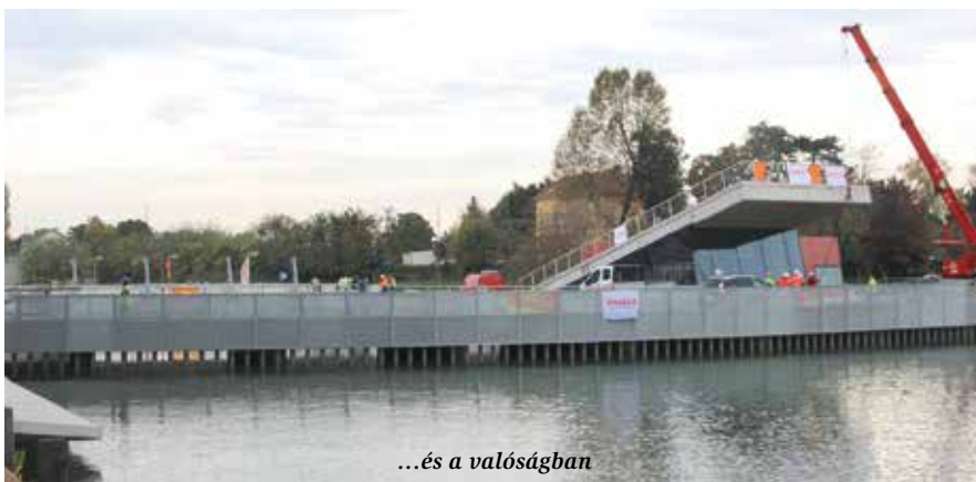
...és a valóságban