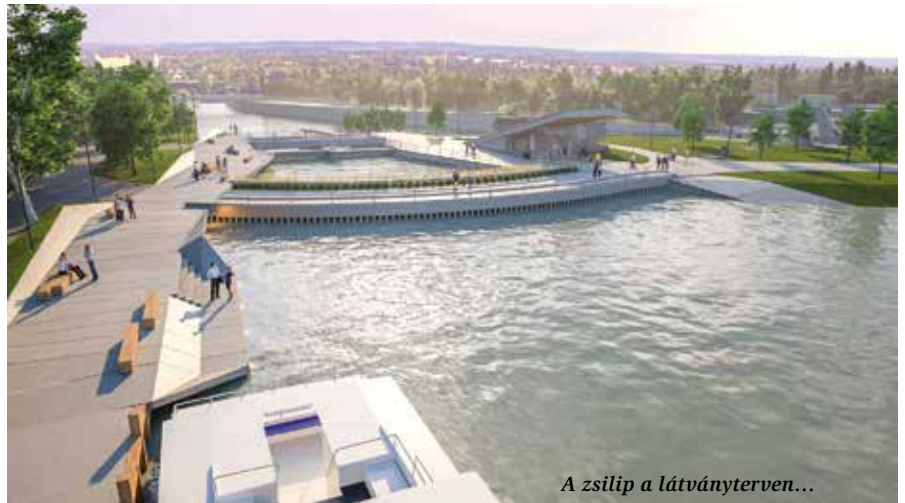
A zsilip a látványterven...

Új vízleeresztő és hajózárszilip, új duzzasztómű Kilitinél, Sió-rekonstrukció – ezek a projekt fő elemei és ahogyan Csonki István, a vízügy közép-dunántúli igazgatója mondta, a 19 milliárd forintos, uniós és hazai forrásból megvalósított beruházás az egyik legnagyobb az igazgatóság életében. Fontos változás, hogy a korábbi üzemi terület megnyílik a nagyközönség előtt, közösségi térré válik, az