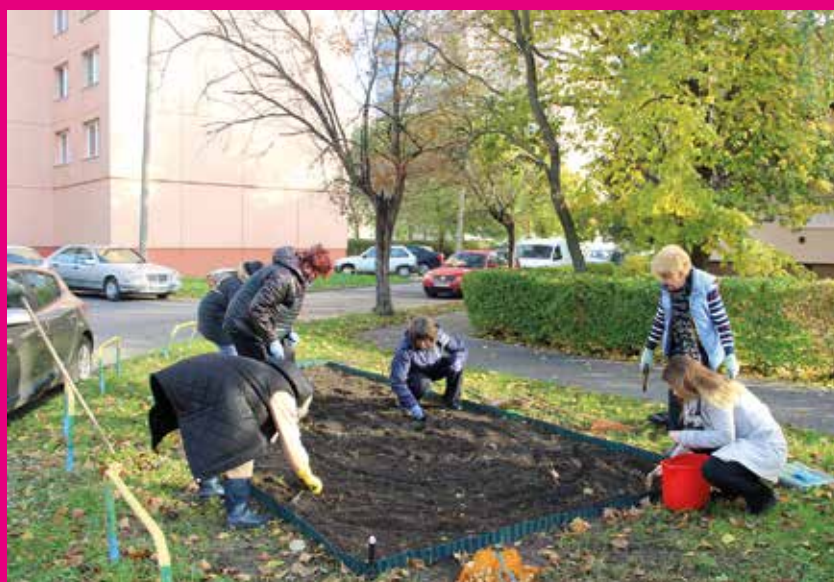
Virágosított a NABE. Várospanapi „felajánlasként” virágágyást létesített és tulipánhagymákat ültetett a Nők a Balatonért Egyesület siófoki csoportja a Jedlik Ányos utcában, a társasházak tövében, együttműködve a városi önkormányzattal.

azonban a polgármester szerint azok, akik a Siókom vagy valamely alvállalkozó cég dolgozóiként, vagy önkormányzati közmunkásként a két kezükkel kapáltak, metszettek, virágosítottak, füvet nyírtak, szemetet szedtek, locsoltak a kánikulában, vagy tették a dolgukat hideg szélben, csepergő esőben is. S az elismerés méltó születésnap ajándék is az 55 éves városnak és minden egyes polgárának.