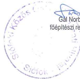
Gál Norbert főépítési referens